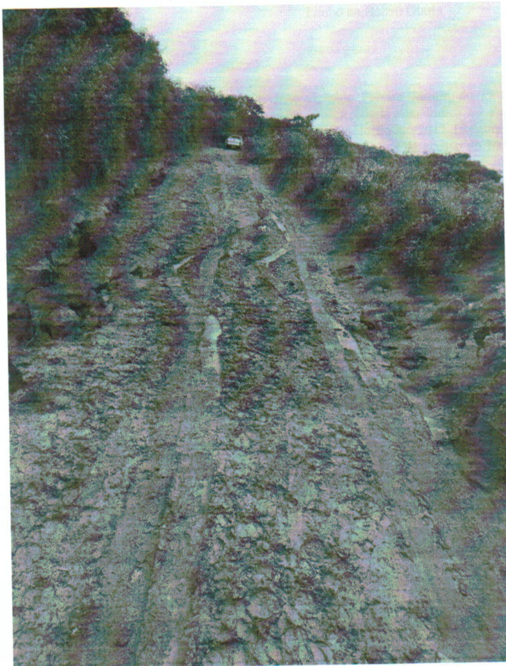
FOTO DA ESTRADA QUE PRECISA DE MANUTENÇÃO

Rua Ana Ribeiro, nº 48 - centro – Seritinga - Estado de Minas Gerais camaraseritinga@hotmail.com CEP 37454-000 - CNPJ: 03.525.423/0001-13