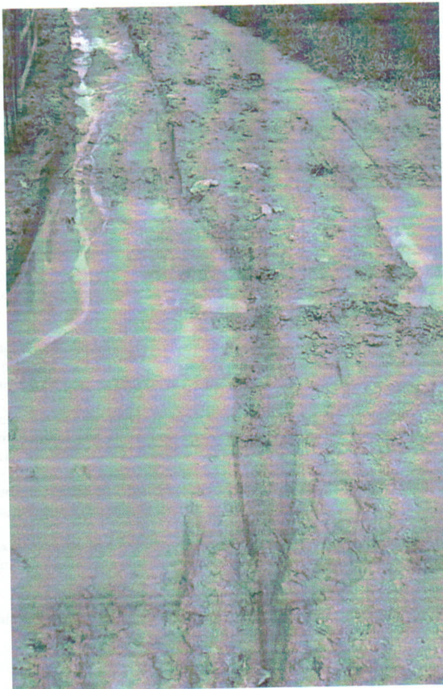
FOTO DA ESTRADA QUE NECESSITA DE MANUTENÇÃO

CEP 37454-000 - CNPJ: 03.525.423/0001-13