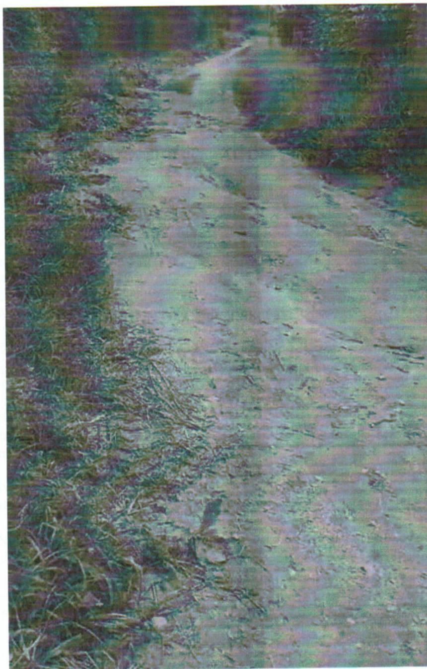
FOTO DA ESTRADA QUE NECESSITA DE MANUTENÇÃO

CEP 37454-000 - CNPJ: 03.525.423/0001-13